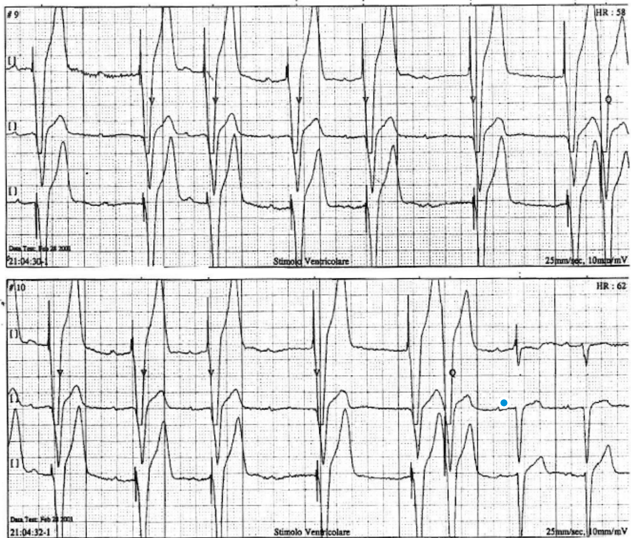
Intervento del pace-maker per un episodio di verosimile BAV totale manifestatosi durante ingestione di una bevanda gasata. Il difetto di sensibilità atriale, lasciando emergere lo stimolatore in modalità VVI, rende più evidente il disturbo di conduzione

Dopo oltre cinque mesi di completa asintomaticità, è stato chiesto al paziente di sottoporsi a un esame Holter: la registrazione evidenziava una fase di verosimile BAV totale della durata di circa 8 secondi, con intervento del pace-maker che manifestava, peraltro, difetti di sensibilità atriale, probabilmente anche a causa di "shifting" del segnapassi sinusale (Figura 2). L'episodio, avvertito come sensazione di cardiopalmo, si era manifestato mentre il paziente, a cena, beveva un bicchiere di birra.