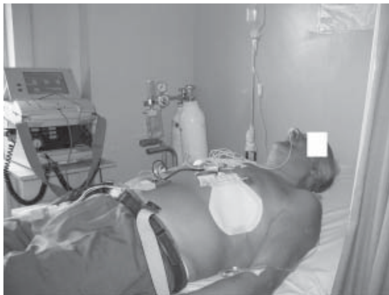
Paziente pronto per la procedura. I 10 elettrodi del catetere esofageo sono collegati tutti insieme al catodo di un defibrillatore bifasico, mentre le due piastre adesive, posizionate sulla regione antero-laterale del torace, sono raccordate tra loro e collegate all'anodo del defibrillatore stesso.