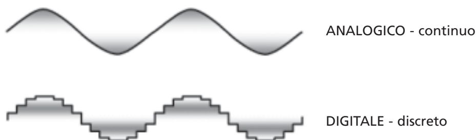
FIGURA 2 Segnale analogico vs. digitale.

gio d'informazione tra la sorgente e l'utilizzatore, un segnale deve essere trasmesso ed eventualmente elaborato. Durante la trasmissione il segnale analogico subisce per sua natura delle distorsioni, inoltre vi si possono sovrapporre dei disturbi, segnali omogenei indesiderati, ma non completamente eliminabili. Un esempio molto espressivo di questo è il sensing atriale: al segnale proveniente dalla depolarizzazione atriale si possono sommare segnali della stessa natura elettrica, provenienti dalla vicina camera ventricolare (sensing del campo lontano ventricolare) e/o dai tessuti circostanti il cuore (miopotenziali). In tal modo l'informazione contenuta nel segnale utile è distorta. L'elettrocatteter atriale riceve e trasporta al pace-maker un segnale con un contenuto informativo non strettamente "atriale". L'informazione così ricevuta può determinare l'intervento del pace-maker con una terapia non appropriata dal punto di vista clinico, ma corretta per il dispositivo. Il rilevamento dei miopotenziali può essere interpretato come una tachiaritmia atriale in atto e